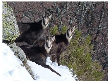
Chamois dans le massif cantalien

Les difficultés du moment invitent à (re)découvrir autrement le Parc des Volcans d'Auvergne et à poser différemment notre regard sur la faune, la flore, nos produits et savoir-faire locaux qui contribuent sans nul doute au développement d'une économie locale qui doit être davantage tournée vers le tourisme bienveillant et écoresponsable.