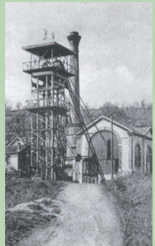
Bois de Lempre Le Puits Madeleine