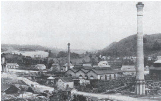
Ydes, le carreau de la mine vers 1900

À partir des années 1850 l'exploitation se professionnalise et la création de la Société Anonyme des Houillères de Champagnac (1858), ainsi que l'annonce de la construction du chemin de fer stimulent définitivement le développement du site.