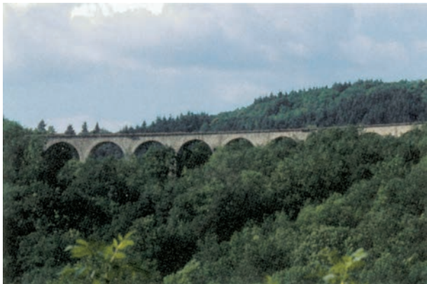
Le Viaduc de Salsignac

Quelque peu délaissé lors de la création des premières voies ferrées du Massif Central, le Haut Cantal réclame dès 1871 la réalisation d'un itinéraire Bort - Neussargues via Condat et Allanche. Ce n'est que vingt ans plus tard que le principe de cette ligne est définitivement acquis, essentiellement pour conquérir le transport des vins du Languedoc et du Roussillon vers Paris.