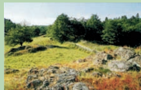
Les Hauts de Verchalles